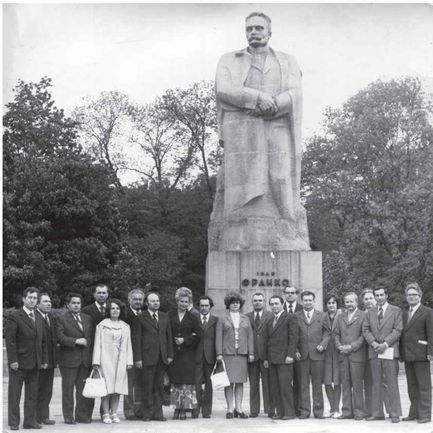
З колективом факультету